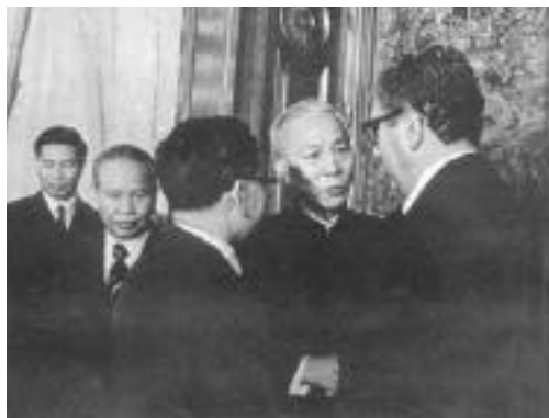
( )가 (가 )