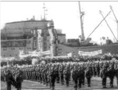
(Da Nang) (1971. 12. 4)