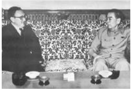
1971 7 , 1971 7 ,