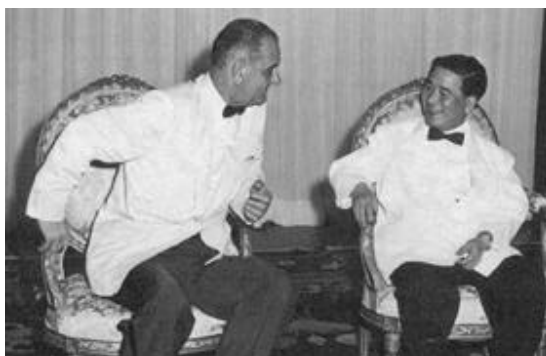
(冷 1961 5 ,